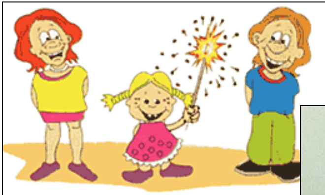
Родители и воспитатели наблюдают за детьми

Закон устанавливает границы неприкосновенности частной жизни , формы ее охраны от неправомерного вторжения. Демократическое цивилизованное государство только в исключительных случаях, на основе закона и специального судебного решения может нарушить неприкосновенность частной жизни человека, ознакомиться с его корреспонденцией или содержанием телефонных либо иных сообщений.