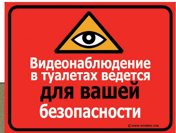
Полицейские ведут наблюдение на улицах и в общественных местах