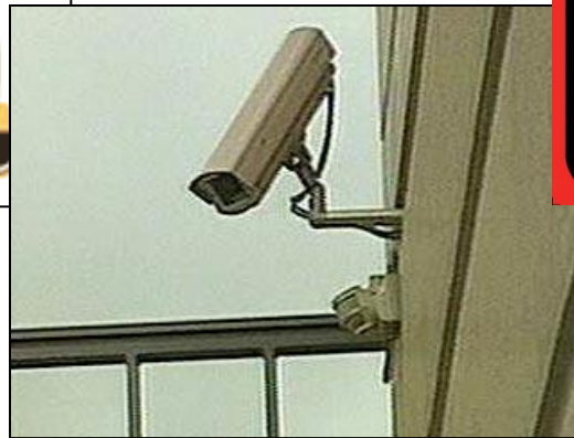
Государственные органы наблюдают за тем, как граждане выполняют различные обязанности и запреты.